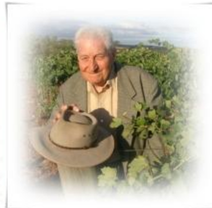
(תמונה של קלרנס ושל הקלרי)