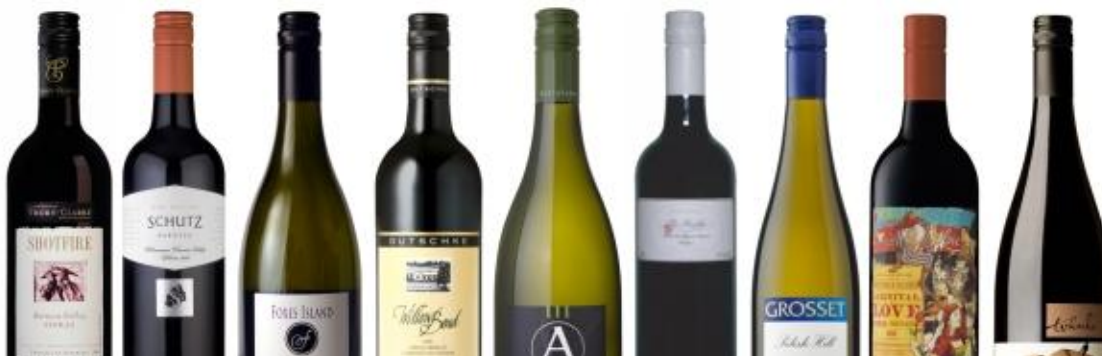
(יינות מרש עם פקקי הברגה)